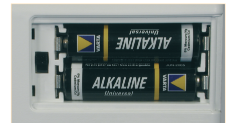
Betrieb mit nur 2 Mignonzellen / Akkus