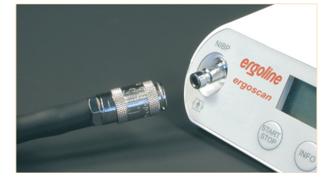
Manschettenschluss aus Metall

Die integrierte Tag-/Nachttaaste ermöglicht das individuelle Einschalten des Nachtintervalls – unabhängig von den programmierten Intervallzeiten. Damit wird die präzise Auswertung der diagnostisch wichtigen Unterschiede zwischen Tag- und Nachtphase auch ohne spätere manuelle Korrekturen ermöglicht. Zusatzmessungen lassen sich jederzeit durch Tastendruck auslösen und die jeweils letzten Messwerte auf dem LC-Display mittels INFO-Taste aufrufen. Lediglich 2 Mignonzellen (Batterien oder Akkus) werden für die Durchführung einer vollständigen 24h-Aufnahme benötigt.